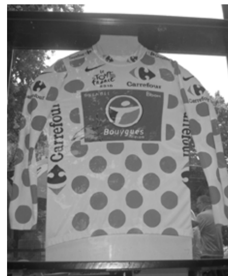
Carrefour, partenaire du Maillot à Pois si convoité